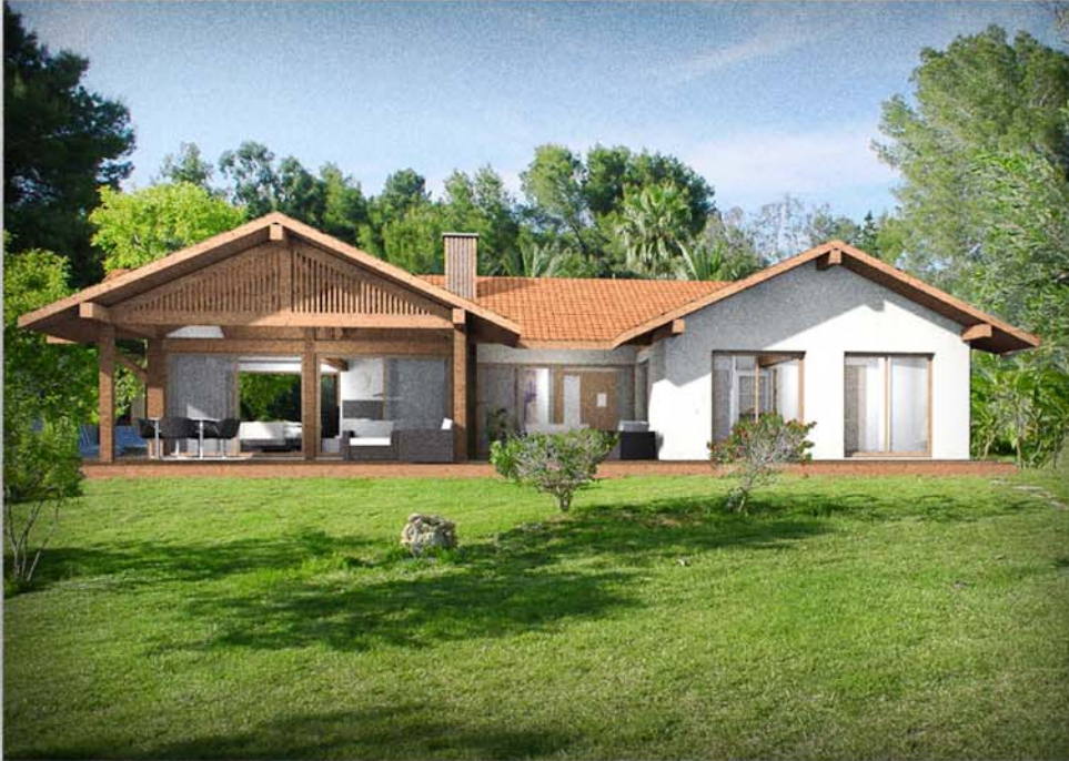
ARGIA acabado raseado